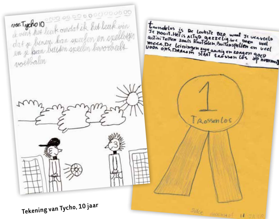
Tekening van Tycho, 10 jaar